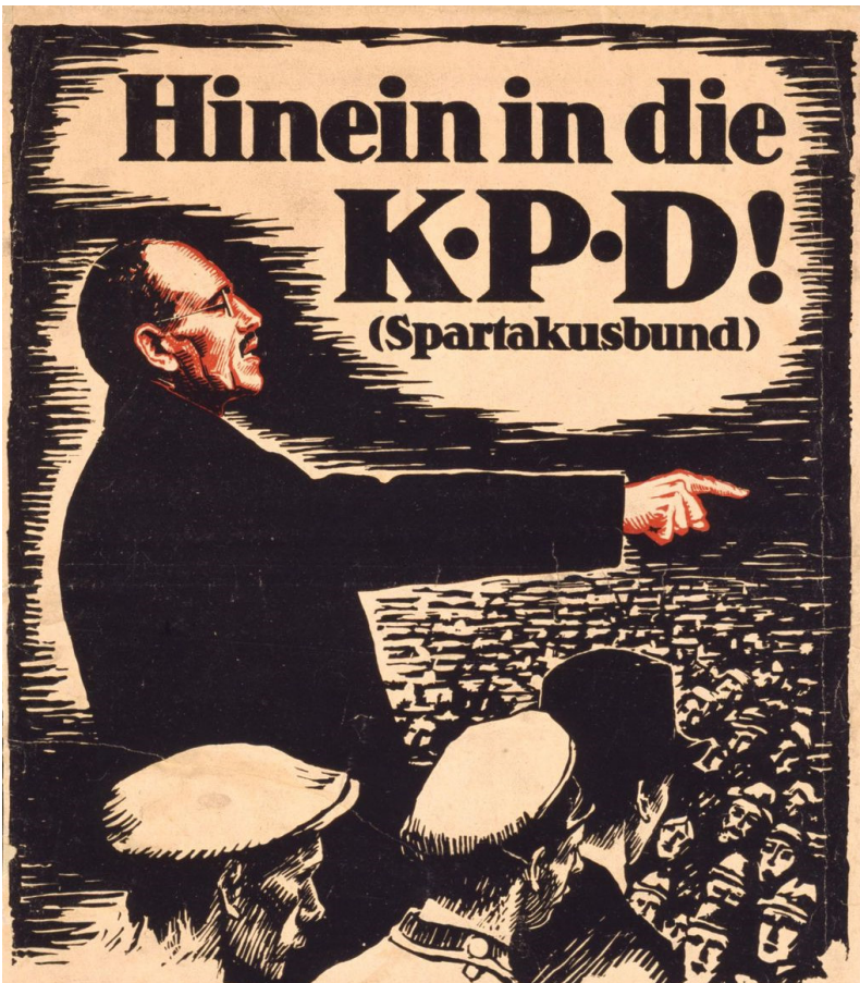
Plakat mit Karl Liebknecht zum Eintritt in die KPD (Spartakusbund), 1919