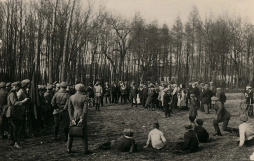
Landagitation durch sog. Agitations- und Propagandatruppen der KPD Ende der 1920er Jahre in Dahlewitz